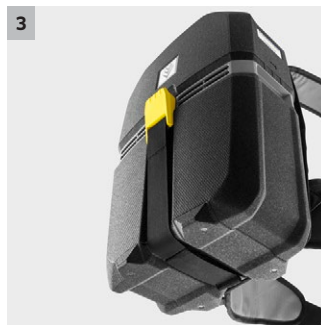
3 Zeer innovatief EPP (geëxpandeerd polypropyleen)