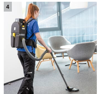
4 Geweldige ergonomie