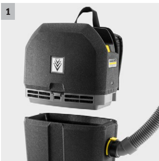
1 Borstelloze EC-aandrijving

Perfect voor het reinigen in krappe ruimtes: de ultralichte, krachtige, batterijgevoede BVL 5/1 Bp Pack rugzakstofzuiger van innovatief, zeer robuust EPP-materiaal.