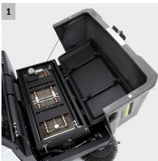
1 Dual filterschraper